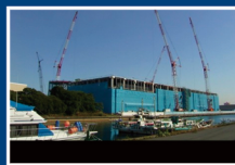
ヤマト運輸 物流ターミナル 神奈川県