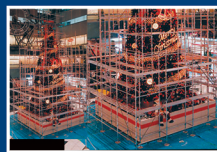
新宿 NSビル クリスマスツリー 東京都