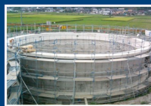
高富浄化センター 岐阜県