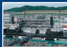
W-inds. 茂木ステージ 栃木県