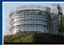
桑名市貯水タンク 三重県